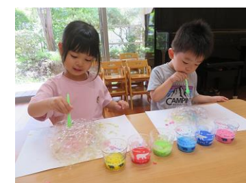
パブルアート：「あわがっはい！」