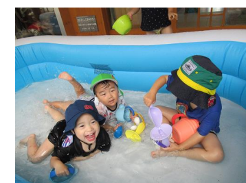
水遊び：「きもちいい☆」