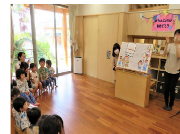
誕生会「おめでとう」