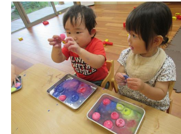
感触遊び：「溶けてく〜」