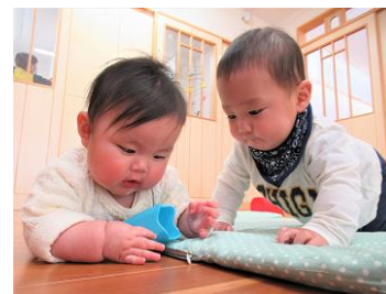
友だちと：「これ、なんだろう」