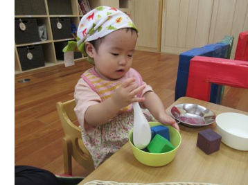
ままごと：「おいしくなあれ」