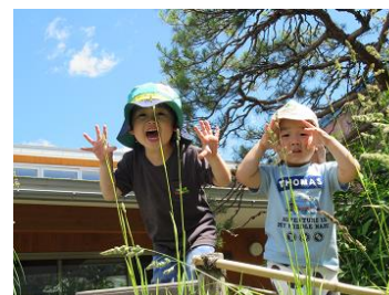
滑り台から：「ヤッホー」