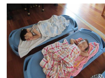
午睡：「ゆっくり休もうね」